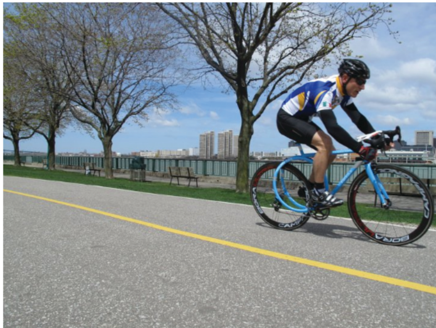
ROLÊ REDONDO: RoundTail sendo testada

Este ano, o canadense Lou Tortola apresentou um projeto que simplesmente pretende redefinir a concepção das bicicletas. Sua invenção, a RoundTail, é uma bike de estrada com traseira arredondada, em vez da tradicional estrutura triangular.